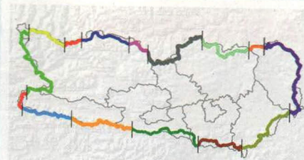
Der Ktn. Grenzweg wird von der Kärntner Alpenvereinsjugend in Etappen in nur einem Tag umwandert